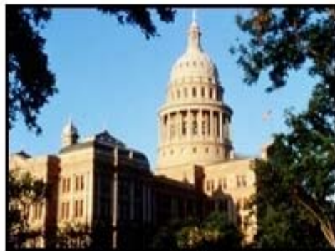
Texas State Capitol