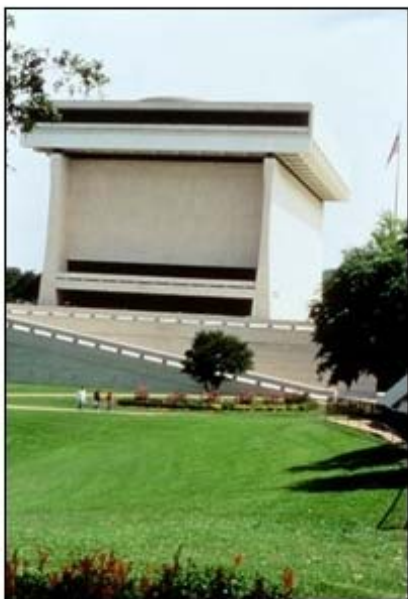
Lyndon B. Johnson Library

بیشتر منابع و مراکز فرهنگی آستین در داخل دانشگاه تکلیزاس قرار گرفته است. این دانشگاه با تعداد دانشجویان بالغ بر 50000 نفر، اعضای هیات علمی بالغ بر 2700 نفر و کارمندان دانشگاه بالغ بر 17000 نفر یکی از بزرگترین جوامع دانشگاهی در آمریکا به شمار می رود. با توجه به این مساله، سطح فرهنگی جامعه آستین بسیار بالا بوده و یکی از امنترین و شادترین شهرهای آمریکا به شمار می رود. وجود کتابخانه های متعدد و غنی در داخل دانشگاه و همچنین در سطح شهر از مزایای بالای زیستن در این منطقه از تکلیزاس است. به سبب این مساله نرخ ناهنجاریهای شهری در آستین پایین بوده و این شهر یکی از 10 شهر برتر آمریکا در این زمینه است.